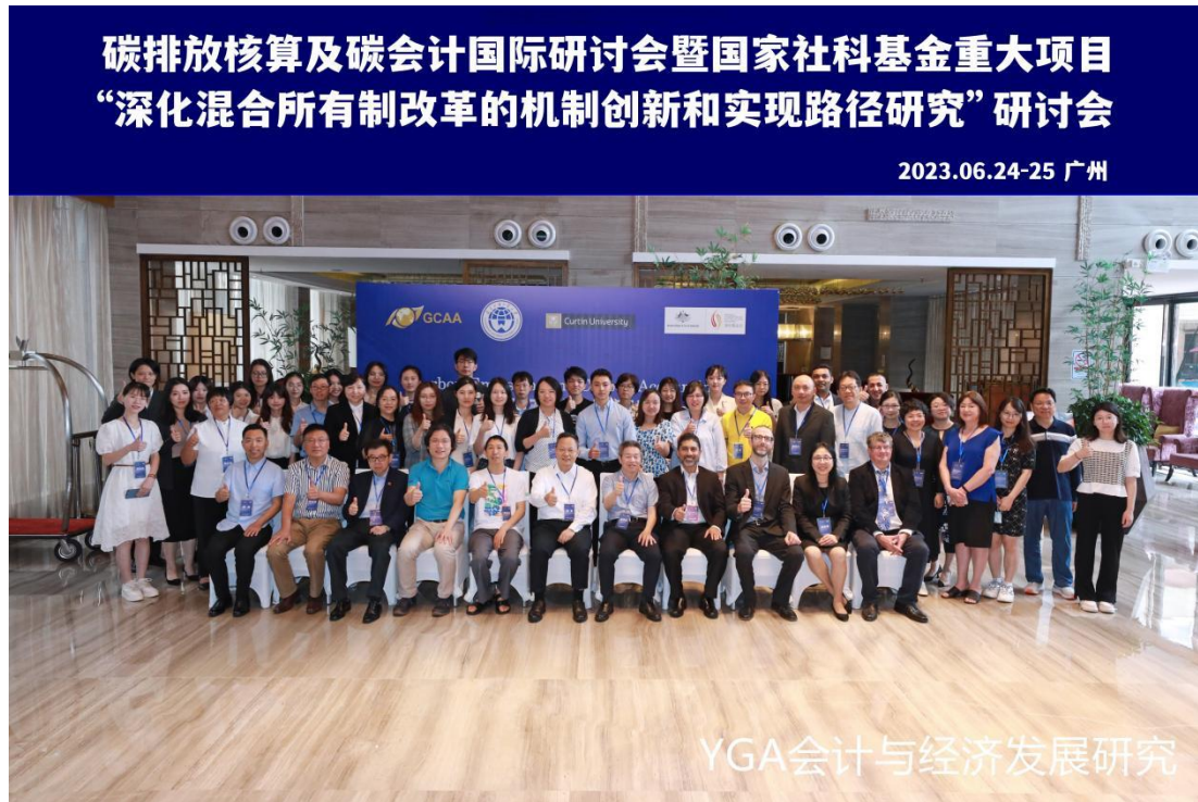
碳排放核算及碳会计国际研讨会暨国家社科基金重大项目“深化混合所有制改革的机制创新和实现路径研究”研讨会合影

本次碳排放核算及碳会计国际研讨会暨国家社科基金重大项目“深化混合所有制改革的机制创新和实现路径研究”研讨会顺利举办。收获众多参与人员的认可与好评，为汇聚一堂的各位学者和专业人士提供了学习与合作的机会。