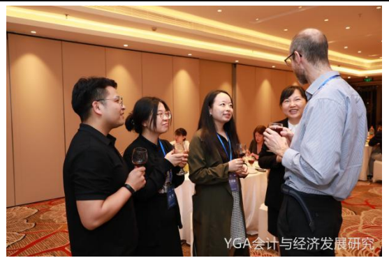
碳排放核算及碳会计国际研讨会暨国家社科基金重大项目“深化混合所有制改革的机制创新和实现路径研究”研讨会现场